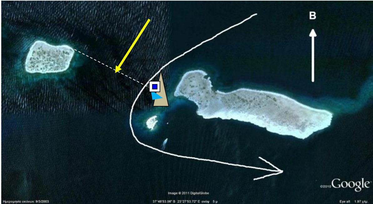
Σχ. 3 - Επιβράχυνση / Τερματισμός στη ΛΑΓΟΥΣΑ